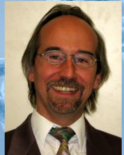
Szathmáry Eörs Evolúcióbiológia